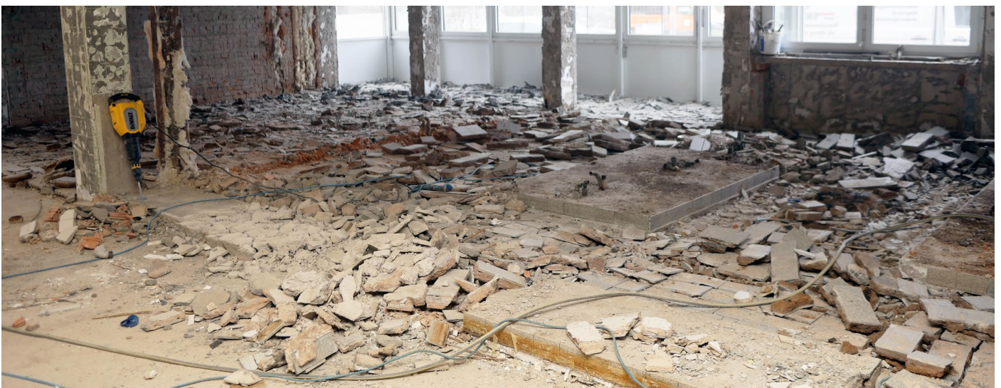
Der Blick in die alte Küche, von der in der Abrissphase nur noch ein paar Steinhaufen übriggeblieben waren.

Mittelfristig geplant soll auch die in die Jahre gekommene Förderschule „Am Kleefeld“ mit ihrer inzwischen maroden und derzeit provisorisch abgedichteten Turnhalle neugebaut bzw. saniert werden. Hierfür werde nach ersten Kostenschätzungen mit einem zweistelligen Millionenbetrag kalkuliert. Das Ausschreibungsverfahren für die Vergabe der Fachplanungen ist abgeschlossen, ein konstruktives und ausführliches Startgespräch mit den entsprechenden Fördermittelgebern fand bereits statt. Gebaut soll jedoch erst dann werden, laut Stadler, wenn die Gegenfinanzierung stehe. Die Umsetzung dieses Projektes wäre ein weiterer wichtiger Schritt für die Fortschreibung der HPZ-Erfolgsgeschichte.