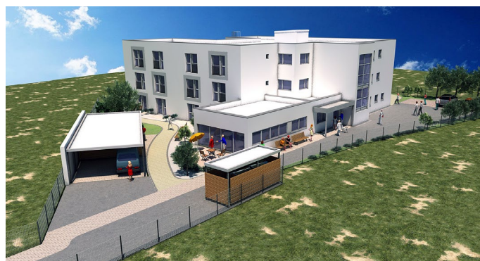
Ein weiteres Schmuckstück wird das neue Wohnheim „Hinterm Rangierbahnhof“, welches das HPZ in der Stadt Weiden bauen wird.