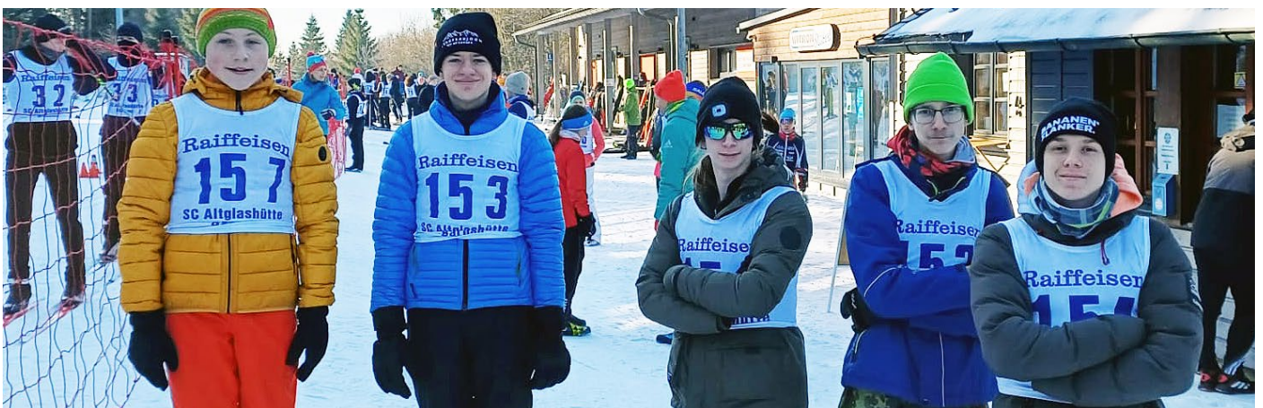
Starker Auftritt: Die Skilangläufer des HPZ Irchenrieth überzeugten bei „Jugend trainiert für Olympia“ in jeglicher Hinsicht.

Auch bei der Siegerehrung gab es besondere Anerkennungen: Die erstplatzierte Mannschaft jeder Kategorie im Kreis Weiden-Neustadt/WN erhielten T-Shirts, die von der Sparkasse gestellt wurden. Zudem durften sich die ersten drei Mannschaften im Bezirksfinale über Medaillen freuen. Das Bezirksfinale Skilanglauf unterstrich einmal mehr den hohen Stellenwert des ungemein wichtigen Schulsports in der gesamten Oberpfalz und zeigte eindrucksvoll, dass „Jugend trainiert für Olympia“ nicht nur sportliche Leistungen fördert, sondern auch Gemeinschaft, Fairness und Inklusion in den Mittelpunkt stellt.